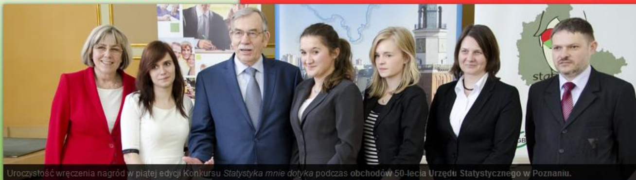
Uroczystość wręczenia nagród w piątej edycji Konkursu Statystyka mnie dotyczy podczas obchodów 50-lecia Urzędu Statystycznego w Poznaniu.