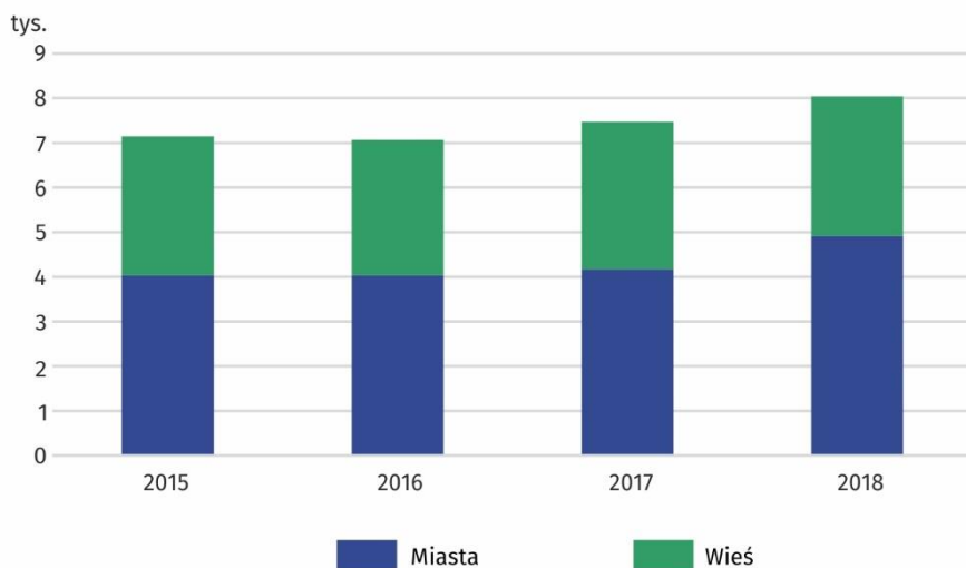
Wykres 1. Mieszkania oddane do użytkowania w województwie łódzkim

Liczba mieszkań oddanych do użytkowania w miastach była wyższa o 17,8% r/r, natomiast na terenach wiejskich była niższa o 5,1%