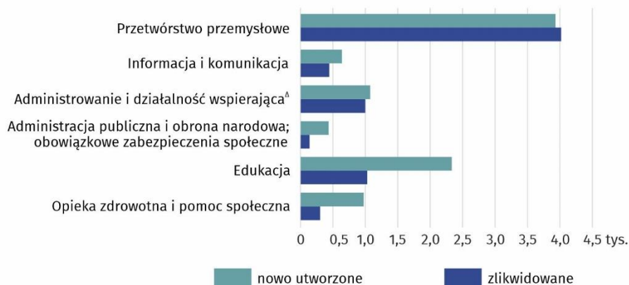
Wykres 2. Nowo utworzone i zlikwidowane miejsca pracy według wybranych sekcji PKD 2007 w 2023 r.

W 2023 r. najwięcej, bo 20,8% nowych miejsc pracy utworzono w budownictwie (5,3 tys.), 18,0% w handlu; naprawach pojazdów osobowych (4,6 tys.) oraz 15,5% w przetwórstwie przemysłowym (3,9 tys.).